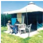
Bungalow toilé Trigano (4 pers.)